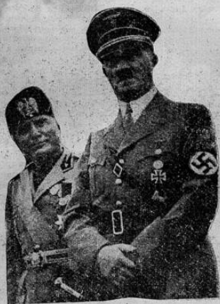
HITLER Y MUSSOLINI